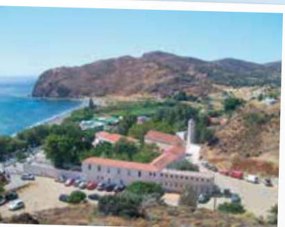
10 Αγία Μαρκέλλα - Aghia Markella