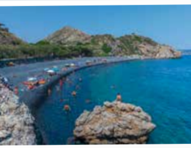
4 Εμπορείος - Μαύρα Βόλια Emporios - Mavra Volia