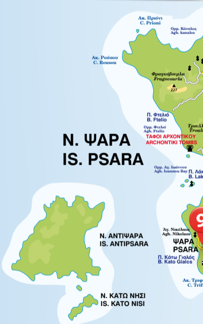
Ν. ΨΑΡΑ IS. PSARA