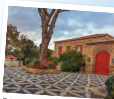
3 Κάμπος - Kampos