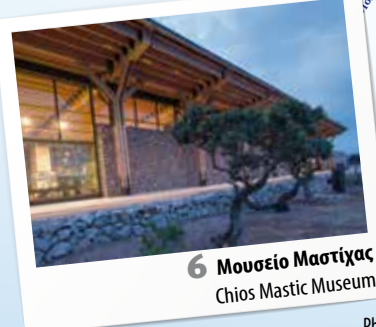
6 Μουσείο Μαστίχας Chios Mastic Museum