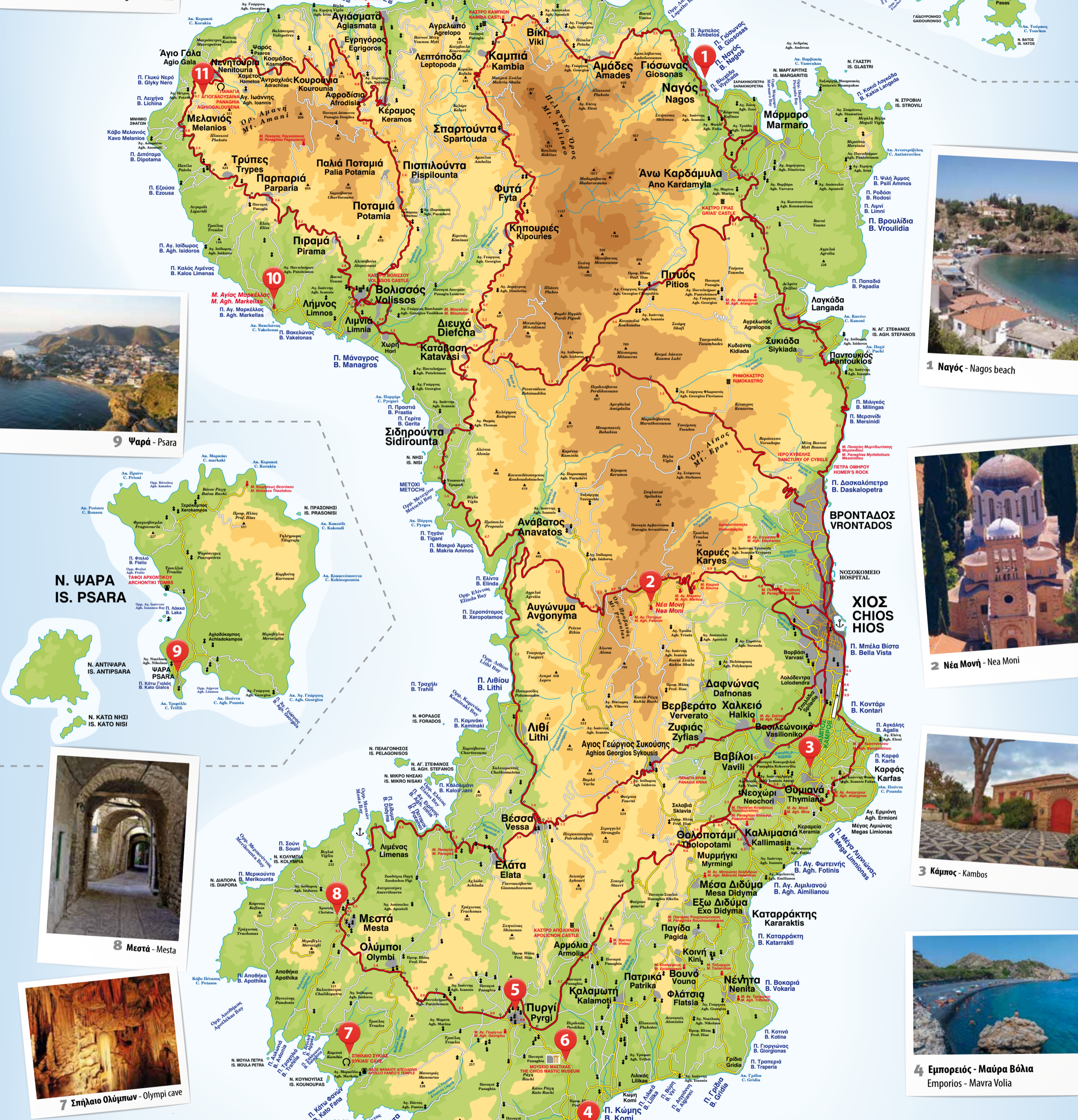
Ν. ΒΕΝΕΤΙΚΟ IS. VENETIKO