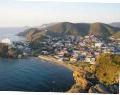
9 Ψάρα - Psara