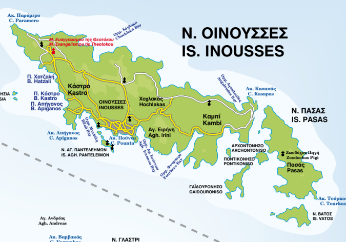
Ν. ΟΙΝΟΥΣΣΕΣ IS. INOUSSES