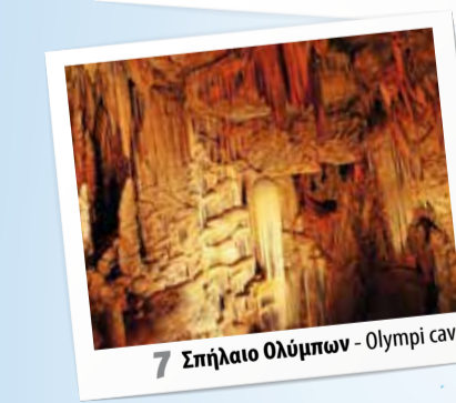
7 Σπήλαιο Ολύμπων - Olympi cave