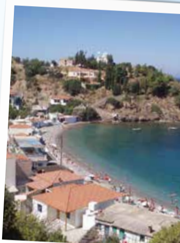
1 Ναγός - Nagos beach