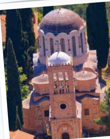
2 Νέα Μονή - Nea Moni