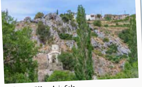
11 Αγιο Γάλα - Agio Gala