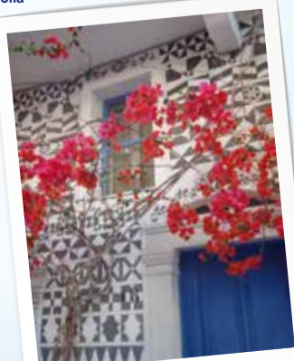
5 Πυργί - Pyrgi